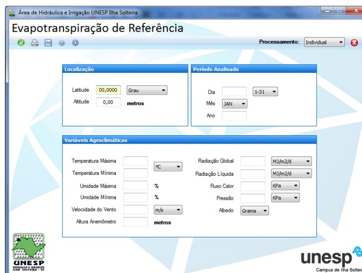
Figura 1. Processamento individual.

O software foi desenvolvido utilizando a linguagem de programação C#, também escrito como C# ou C Sharp (em português lê-se "cê charp"), é uma linguagem de programação orientada a objetos, desenvolvida pela Microsoft como parte da plataforma .NET. A sua sintaxe orientada a objetos foi baseada no C++ mas inclui muitas influências de outras linguagens de programação, como Object Pascal e Java e o requisito mínimo para se instalar o software é um computador com Sistema Operacional Windows XP ou superior e NET Framework 4.