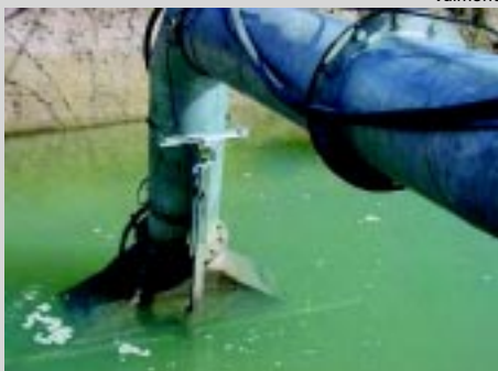
O canal pode ser revestido por concreto ou manta vinílica, evitando manutenção exagerada

fonte e alimenta o canal (sistema linear ou universal linear) ou que pressuriza a linha de adutora no caso de alimentação por mangueira (linear duas rodas) poderá ser diesel ou elétrico, porém para locomoção do cart todos os modelos de lineares necessitam de motor diesel.