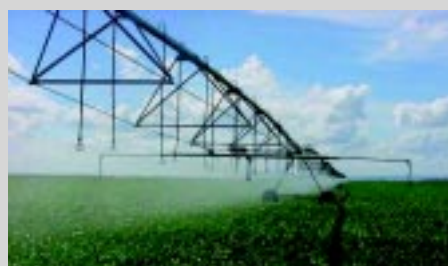
Os lances são sustentados por sistema de treliças e firantes, apoiadas sobre as torres móveis

No caso de alimentação por canal, além de um conjunto motobomba junto à fonte de água, com acionamento elétrico ou diesel e adutora de transporte da água até o canal, tem-se o cart que suportará um conjunto 3x1 composto por um motor diesel, um gerador e uma bomba centrífuga. O motor diesel alimentará o gerador, normalmente de 20 à 30 KVA e através da energia elétrica obtida coordenará os movimentos dos motoredutores (1,5 cv) instalados jun-