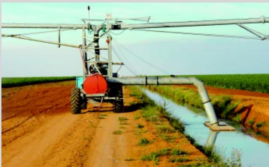
Na alimentação por canal, é construída uma valeta no centro ou na lateral da área a ser irrigada, que acompanha toda a extensão da lavoura

Consegue irrigar uma faixa e, ao final do curso, realizar o pivotamento, ou seja, fazer com que toda a estrutura aérea gire 180° em torno do cart como se fosse um pivô central e voltar irrigando uma faixa adjacente. Desta forma, com a mesma quantidade de lances (torres móveis) irriga o dobro da área, economizando