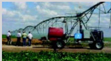
O cart é uma torre de comando, formado por vigas transversais onde se acoplam rodas com redutores

to aos rodados do cart e junto as vigas base das torres móveis dos lances, que por sua vez, transmitirão por eixos cardãs e juntas universais torque aos redutores de roda instalados junto aos pneus que fazem com que toda a estrutura se locomova.